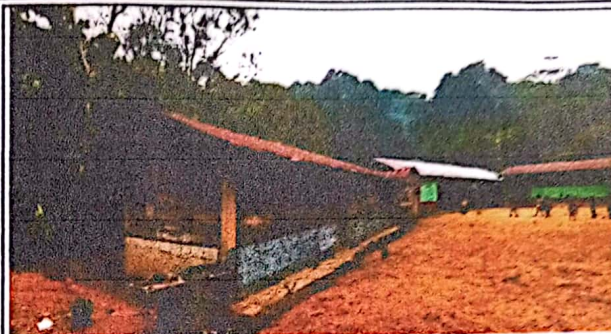
Foto2: Se observa Deterioro en la pila y paredes