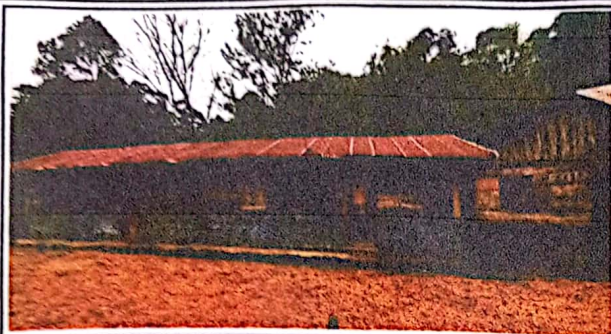
Foto1: Se observa Deterioro en el Techo y forro de la cocina